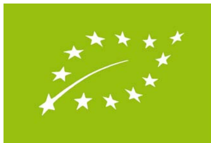
Έγχρωμος Λογότυπος βιολογικής παραγωγής της ΕΕ

Η χρήση του κοινοτικού λογότυπου είναι υποχρεωτική από 01/07/2010 σύμφωνα με τον Καν. (ΕΕ) 271/2010 για την επισήμανση και διαφήμιση προϊόντων που έχουν πιστοποιηθεί ως προς αυτόν. Επιτρέπεται να συνεχιστεί η διάθεση στην αγορά αποθεμάτων προϊόντων που έχουν παραχθεί, συσκευαστεί και σημανθεί πριν από την 1η Ιουλίου 2010, σύμφωνα με τον κανονισμό (ΕΟΚ) αριθ. 2092/91 ή τον κανονισμό (ΕΚ) αριθ. 834/2007, με ενδείξεις που αναφέρονται στη μέθοδο βιολογικής παραγωγής μέχρι την εξάντληση των αποθεμάτων. Το χρώμα αναφοράς Pantone είναι πράσινο Pantone αριθ. 376 και πράσινο [50 % κυανούν + 100 % κίτρινο] όταν χρησιμοποιείται τετραχρωμία.